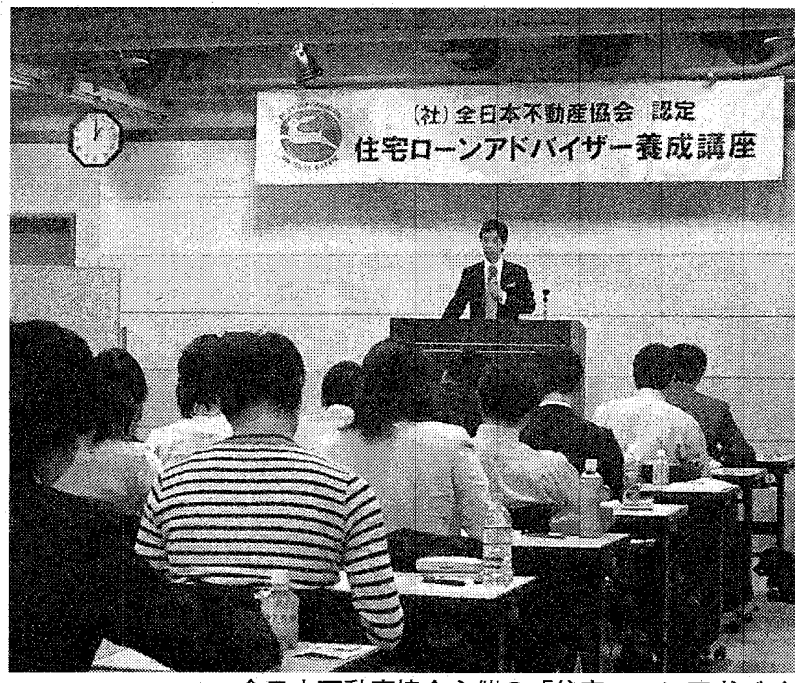
全日本不動産協会主催の「住宅ローンアドバイザー養成講座」。業界関係者にまじって一般の人たちも参加した13日、札幌市

ローン返済は夫(44)の給与と自身のパート収入でまかなっていくつもりだ。「夫の会社は不況に強く、最近はお給料も上がらない」と話す。